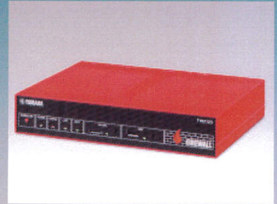
ヤマハセキュリティ ルーターFWX120

被害を受けた金融機関の内訳で見ると、 地方銀行が 48行 （昨年下半期は 19行 ）、信用金庫・信用組合が 11行 （昨年下半期は 0行 ）と、急速に被害が地方へ拡大